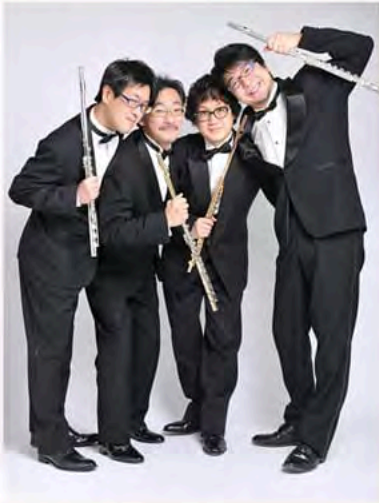
アンサンブル・リュネット